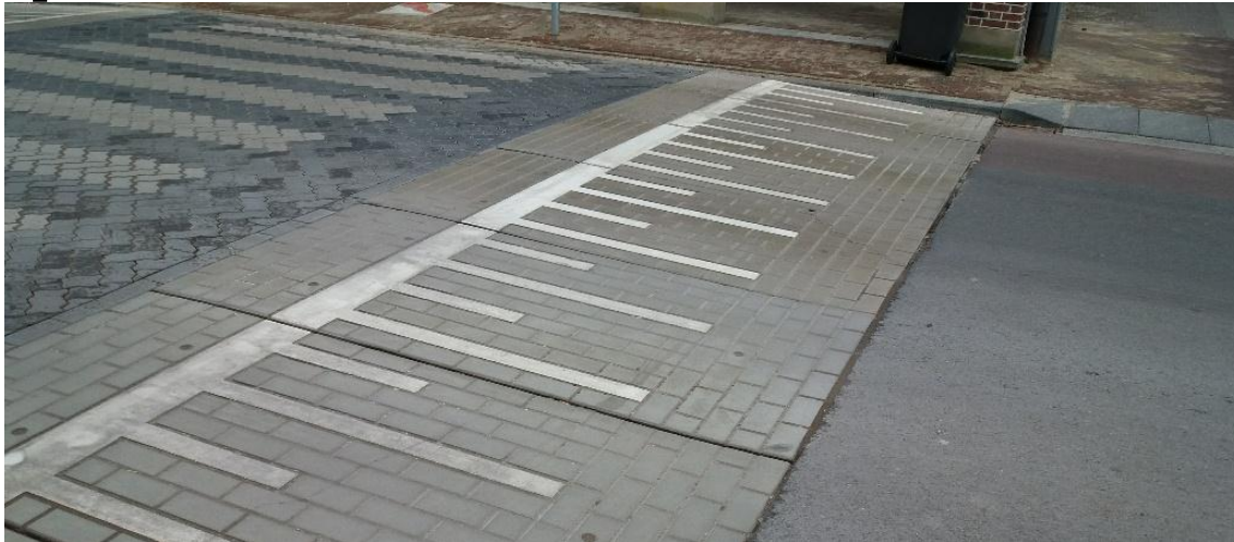
Toepassing verkeersafremming door verkeersdrempels van De Hamer.

Verkeersdrempels en verkeersplateaus zijn volgens CROW het meest effectieve middel om de snelheid van verkeer te beperken en het aantal slachtoffers terug te dringen. Het optimaal effect dat niet tot klachten leiden, wordt verkregen indien aan een aantal voorwaarden wordt voldaan. Daarbij is een goede fundering, aanleg, goed onderhoud en juiste afmeting van groot belang.